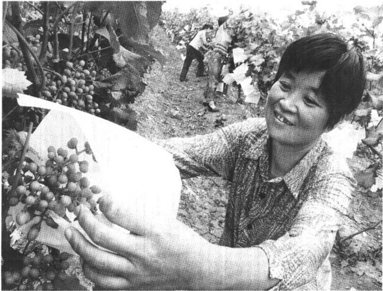
在市良种葡萄、草莓繁育推广中心，园艺工人们正忙着给“美国大粒无核王”葡萄套袋。这种绿色无公害果品还没到成熟期就被订购一空，年收入60余万元。该中心自2000年就开发种植绿色无公害果品，良种辐射周边地区，今年还无偿支援内蒙地区2万棵草莓苗。