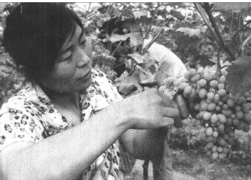
6月8日,广西兴安县的农民在修剪葡萄。该县是葡萄标准化示范基地。