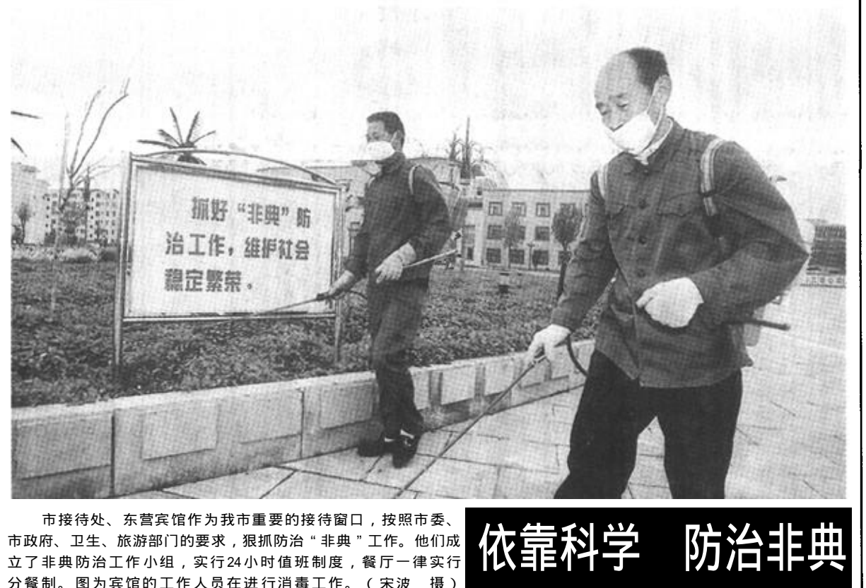
市接待处、东营宾馆作为我市重要的接待窗口，按照市委、市政府、卫生、旅游部门的要求，狠抓防治“非典”工作。他们成立了非典防治工作小组，实行24小时值班制度，餐厅一律实行分餐制。图为宾馆的工作人员在进行消毒工作。

确保三夏安全供电 利津讯 “三夏”用电高峰来临之际，利津县供电公司研究部署安全供电工作，组织“三为”服务队，深入生产一线，到田间、麦