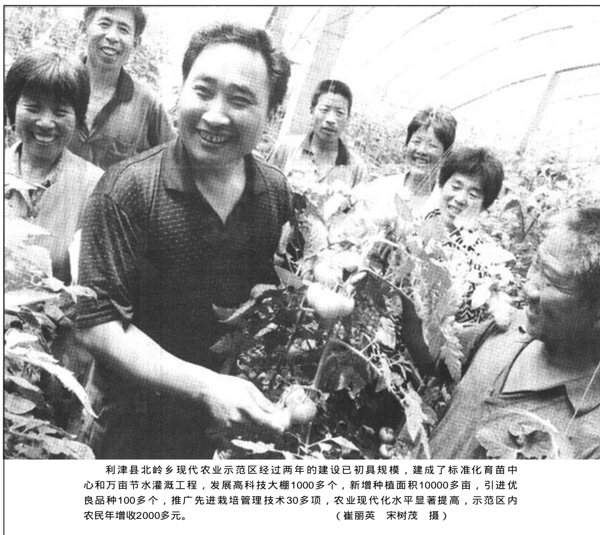
利津县北岭现代农业示范区经过两年的建设已初具规模，建成了标准化育苗中心和万亩节水灌溉工程，发展高科技大棚1000多个，新增种植面积10000多亩，引进优良品种100多个，推广先进栽培管理技术30多项，农业现代化水平显著提高，示范区内农民年增收2000多元。